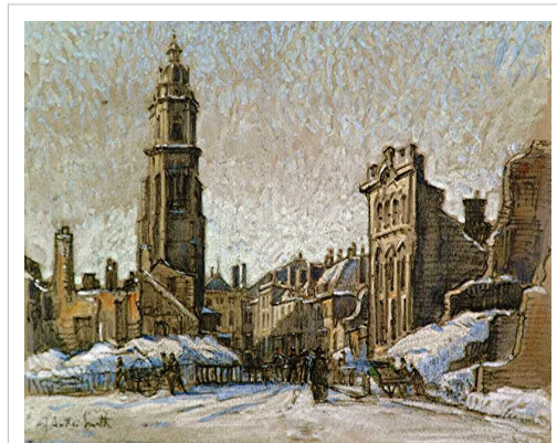
Kamerijk tijdens de Eerste Wereldoorlog, schilderij van Jules André Smith