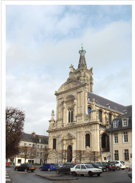
Onze-Lieve-Vrouwekathedraal van Kamerijk (voormalige abdijkerk van de Heilig-Grafabdij, 18e eeuw)

Zoals veel plaatsen in Noord-Frankrijk heeft Kamerijk een Nederlandse en een Franse benaming. De namen Kamerijk en Cambrai zijn beide apart ontwikkeld uit de Gallo-Romeinse naam Camaracum . Niettemin is Kamerijk vanaf de Romeinse tijd steeds een Romeinse, Franstalige stad geweest. Dat er een aparte Nederlandse naam bestaat, is te danken aan de belangrijke rol die de stad speelde in de geschiedenis van de Nederlanden als hoofdstad van een bisdom ( civitas nerviorum ) dat in de middeleeuwen reikte tot diep in Nederlandstalig gebied (o.a. Zuid-Oost-Vlaanderen, Antwerpen, Brussel, de Kempen).