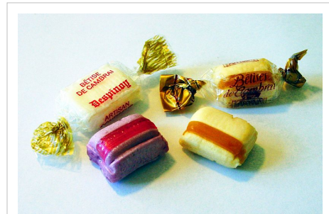
Verschillende bêtises de Cambrai, rechts het origineel